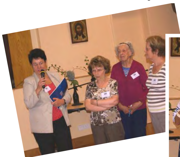
AREC 75 (congrès 2011)