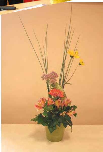
AREC 22 Congrès 2014