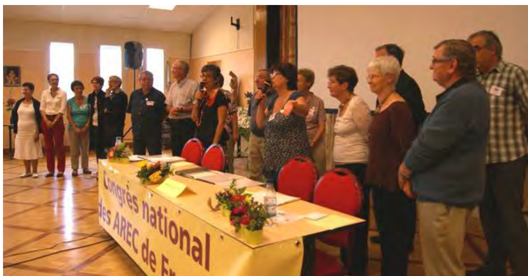
Les membres du C.A. 49 présents au congrès