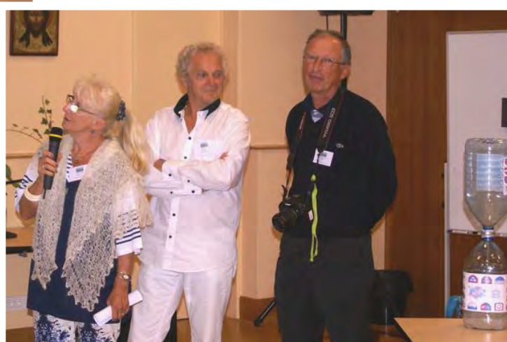
AREC 33 (congrès 2012)