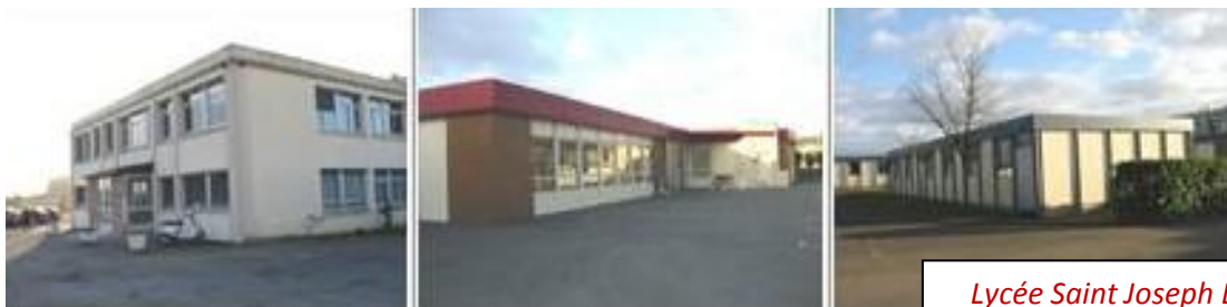
Lycée Saint Joseph Lorraine

Le « Repas de Gala » a eu lieu au Groupe scolaire « Saint Joseph-Lorraine » de Pruillé le Chétif .