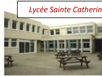
Lycée Sainte Catherine