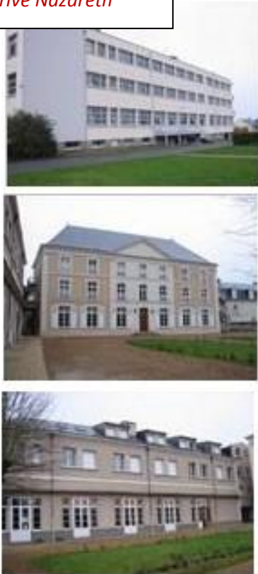
Lycée Privé Nazareth

Les élèves du Lycée « Nazareth » de Ruillé sur Loir avaient réalisé une composition florale qui a joliment décoré la table des « officiels »