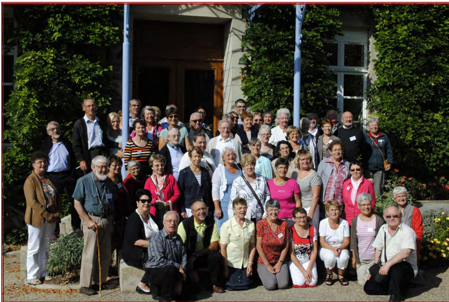
Groupe des congressistes de l'année 2014 dans les Côtes d'Armor

Nous devons la bonne marche et la réussite de ce Congrès à chacune et chacun d'entre vous qui nous avez rejoints avec votre sourire, votre enthousiasme, votre participation au travail dans la bonne humeur !