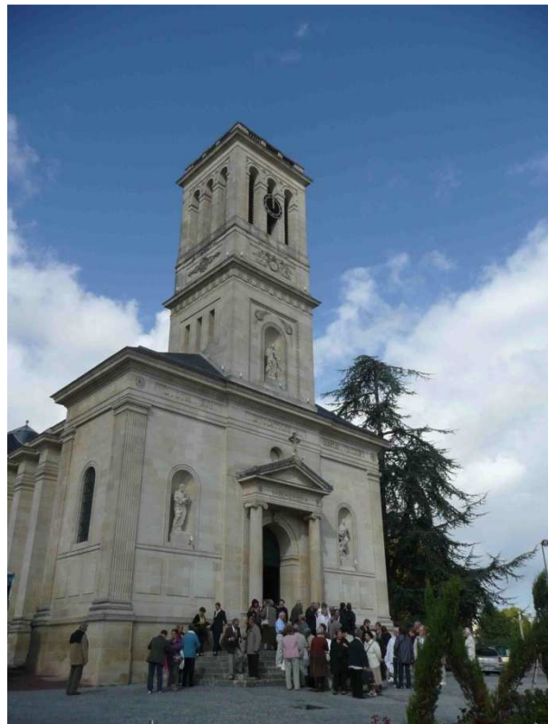
Sortie de la célébration