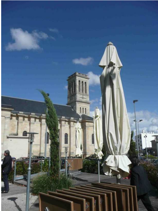
Eglise depuis la Brasserie du 7 ème Art